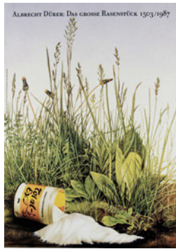
Klaus Staeck: Das große Rasenstück, 1987

© Edition Staeck, VG Bild-Kunst, Bonn 2024