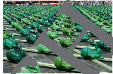
Ottmar Hörl: Das große Hasenstück, 2017

Mit der Kunstinstallation „Das große Hasenstück“ zitiert Ottmar Hörl gleich zwei berühmte Werke Dürers: neben dem „Rasenstück“ auch das des „Feldhasen“ (1502). Aus Anlass des 500. Jubiläums des „Großen Rasenstücks“ installierte der Künstler 7000 grüne Nachbildungen des Dürer-Hasen auf dem Marktplatz in dessen Heimatstadt Nürnberg, sodass der Eindruck einer Hasenfläche entsteht.