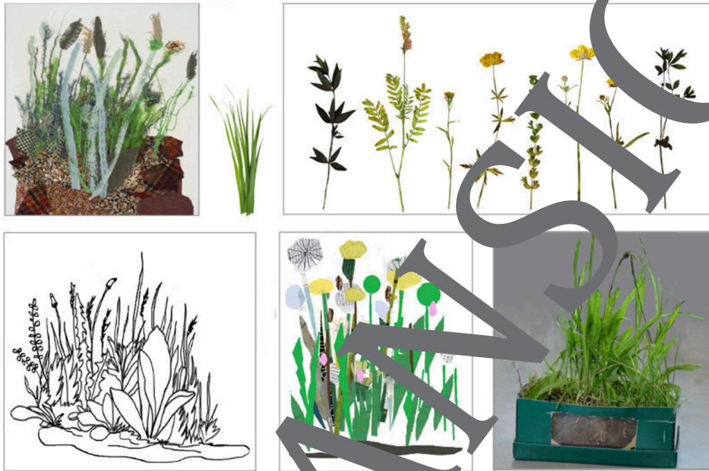
Beispielerggebnisse; oben Mitte und rechts

Grünanlagen, Fußballplätze, Gärten, Wiesen – Rasenstücke sehen wir täglich. Aber wann nehmen wir uns schon einmal die Zeit, sie ganz genau zu betrachten? Albrecht Dürer hat das getan und „Das große Rasenstück“ gestaltet. Seine Naturstudie, die an Detailgenauigkeit kaum zu überbieten ist, steht im Mittelpunkt dieses Beitrags. Sie legt nicht nur zum genauen Hinschauen und Hinterfragen an, sondern bietet darüber hinaus auch viele Ideen, sich kreativ mit Dürers Werk auseinanderzusetzen.