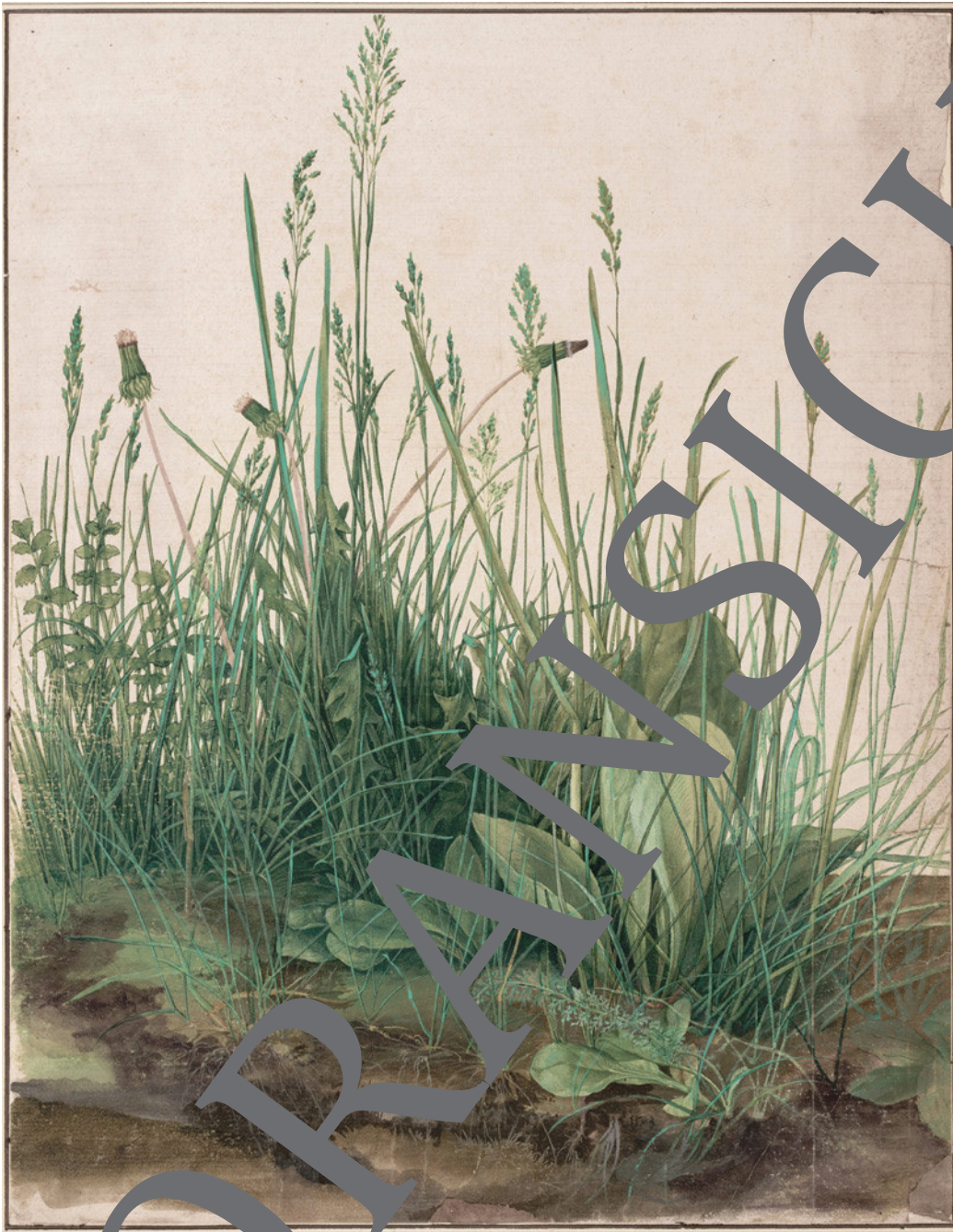
Albrecht Dürer: Das große Rasenstück, 1503; 40,8 × 31,5 cm, Aquarell auf Karton; Albertina, Wien