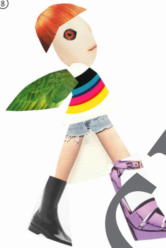
Klaudia Schifferle: Paperdoll, 2011–2016

© Klaudia Schifferle/VG Bild-Kunst, Bonn 2024