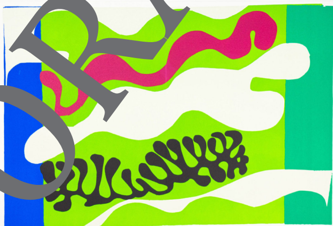
Henri Matisse: Die Lagune, 1947, Scherenschnitt/Collage

© 2024 Succession H. Matisse/VG Bild-Kunst, Bonn 2024