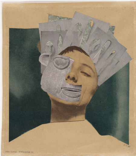
Hannah Höch: Indische Tänzerin. Aus einem ethnografischen Museum, 1930, Collage/Fotomontage