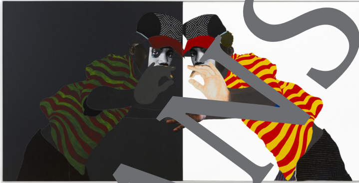
Deborah Roberts: Tomorrow, tomorrow and tomorrow, 2023, Collage und Malerei