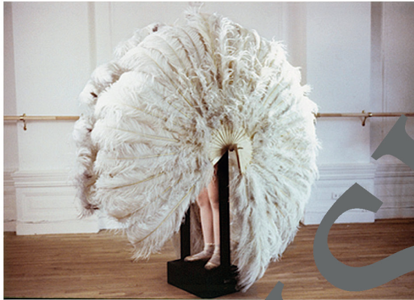
Rebecca Horn: Die sanfte Gefangene, 1978