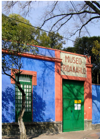
Das Blaue Haus (Casa Azul), in dem Frida viele Jahre lebte

Auf dem Bild rechts siehst du Frida Kahlo als Mädchen. Ihr vollständiger Name war Magdalena Carmen Frida Kahlo. Sie wurde am 6. Juli 1907 geboren und stammte aus Coyoacán. Das ist ein Stadtteil von Mexiko-Stadt. Später behauptete sie, sie sei im Jahr 1910 geboren. Sie tat dies, weil im Jahr 1910 die Mexikanische Revolution begann, die für sie sehr wichtig war.