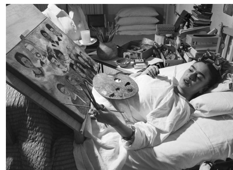
Frida Kahlo malend in ihrem Krankenbett

1921 ging sie auf eine Schule für besonders begabte Schülerinnen und Schüler, die dort auf ein Studium vorbereitet wurden. Sie gehörte zu den besten Mädchen, die an dieser Schule angenommen