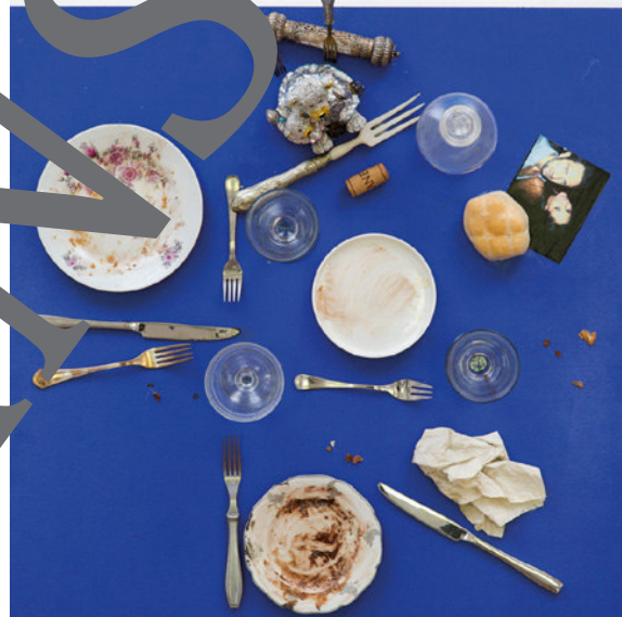
Daniel Spoerri: Fallenbild aus der Serie „Il Bistrot di Santa Marta“, 2014 © VG Bild-Kunst, Bonn 2022