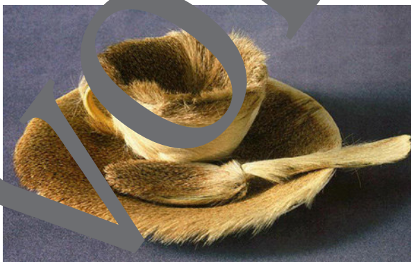
Meret Oppenheim: Frühstück im Pelz, 1936 © VG Bild-Kunst, Bonn 2022