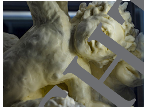
Susana Alhäuser: Monumento II (Detail), 2019.