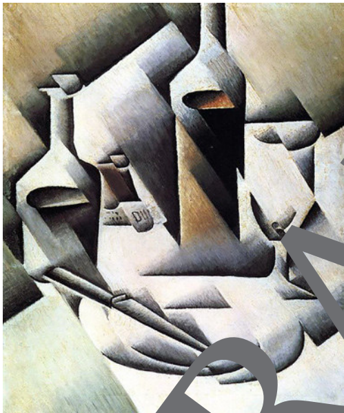
Juan Gris: Stillleben mit Flasche und Messer, 1911/12