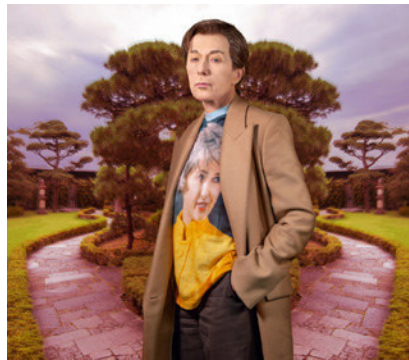
Cindy Sherman: Untitled #602, 2019