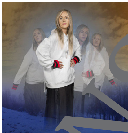
Cindy Sherman: Untitled #587, 2018