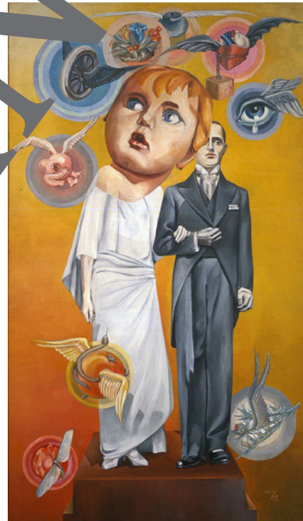
Die Braut, 1924–27, Öl auf Leinwand, 114 x 66 cm, Berlinische Galerie