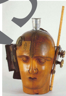
Raoul Hausmann: Mechanischer Kopf (Der Geist unserer Zeit), 1920

Aufgabe 3: Wähle eines der Werke aus und beschreibe es so genau wie möglich.