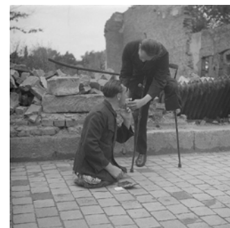
Von links oben nach rechts unten: Marion Golsteij; Foto: Walery, Public Domain; Plakat: Franz Koenner; Gemälde: Otto Dix/VG Bild-Kunst, Bonn 2022; Plakat: Marcel Slodki, Public Domain; Foto: Archive Holdings Inc./The Image Bank/ Getty Images; Foto: Bundesarchiv, Bild-Nr. 183-R17289; Foto: Richard Peter/Deutsche Fotothek/Wikimedia cc by sa 3.0