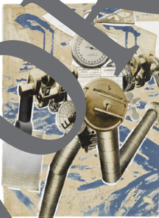
John Heartfield: Die Rationalisierung marschiert – Ein Gespenst geht um in Europa, 1927