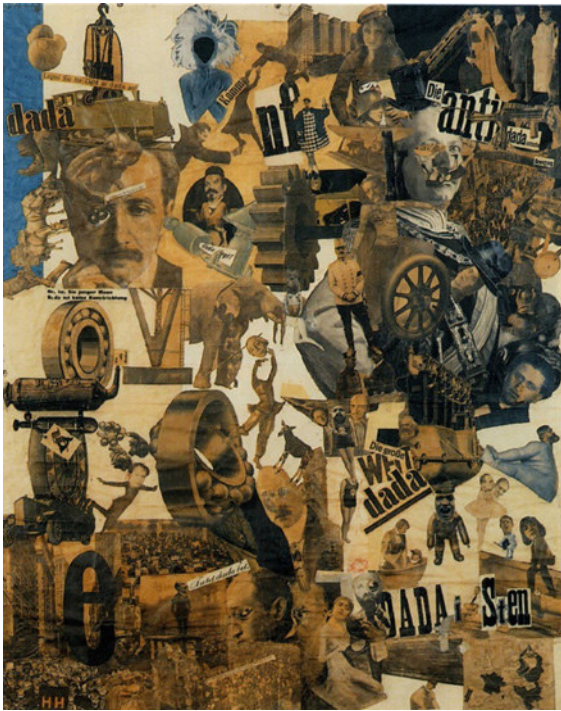
Schnitt mit dem Küchenmesser, 1919, Collage auf Karton, 114 x 90 cm, Nationalgalerie Berlin