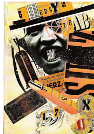
Raoul Hausmann: ABCD (Selbstporträt), 1923/24