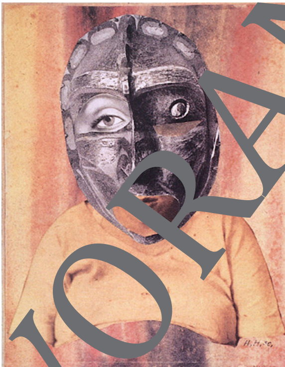
Aus einem ethnographischen Museum: Mutter, 1925/26, Wasserfarben und Fotocollage auf grauem Papier, 41 x 35 cm