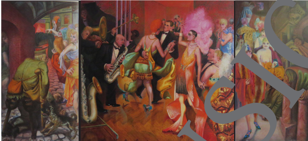
© Otto Dix/VG Bild-Kunst, Bonn 2021

Die 1920er-Jahre waren ein faszinierendes Jahrzehnt voller Extremis und Gegensätze – gezeichnet vom schweren Erbe des Ersten Weltkriegs, abnehmender Generationen, von Aufbruchsstimmung und Hoffnung. Den politischen Verhältnissen zum Trotz blühten Kunst und Kultur auf, geprägt vor allem von einem neuen Sehen und einer neuen, teils kritischen Sicht auf die Welt. Dieser Beitrag beleuchtet die wichtigsten Strömungen jener Zeit. Er stellt Ideen, Werke, Künstlerinnen und Künstler vor und macht das künstlerische Schaffen der Goldenen Zwanziger auch anhand von Aufgaben praktisch nachvollziehbar.