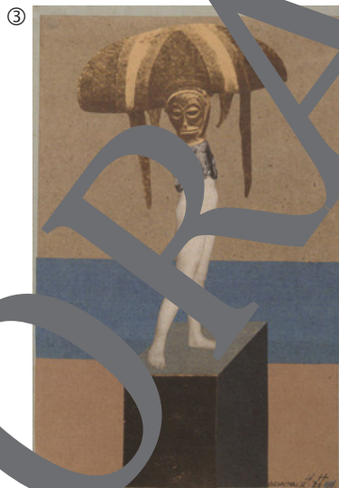
Hannah Höch: Denkmal II: Eitelkeit, 1926; Fotomontage/Collage auf Tonpapier, 25,8 x 16,7 cm; Germanisches Nationalmuseum, Nürnberg