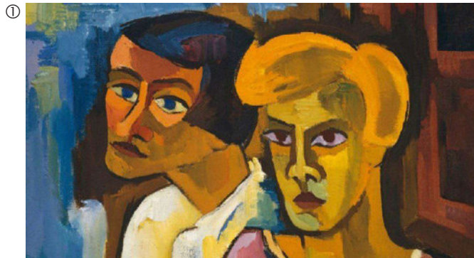
Karl Schmidt-Rottluff: Freundinnen, 1926; Öl auf Leinwand, 87 x 101 cm; Brücke-Museum, Berlin