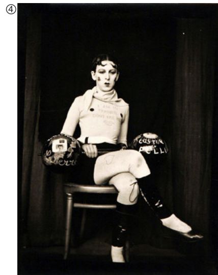
Claude Cahun: Selbstporträt (als Gewichtheber), 1927; Fotografie/Silbergelatine, 12 x 9 cm; Jersey Heritage Collection