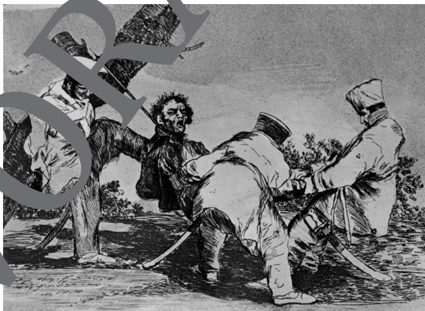
Francisco de Goya: Warum? (aus: Die Schrecken des Krieges), ca. 1814–1820; Radierung