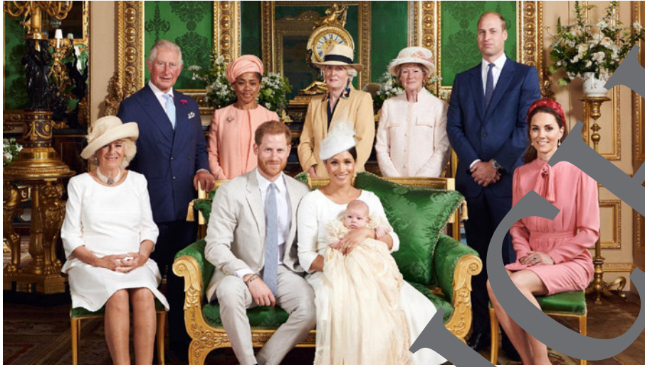
Gruppenfoto der britischen Königsfamilie, Juli 2016