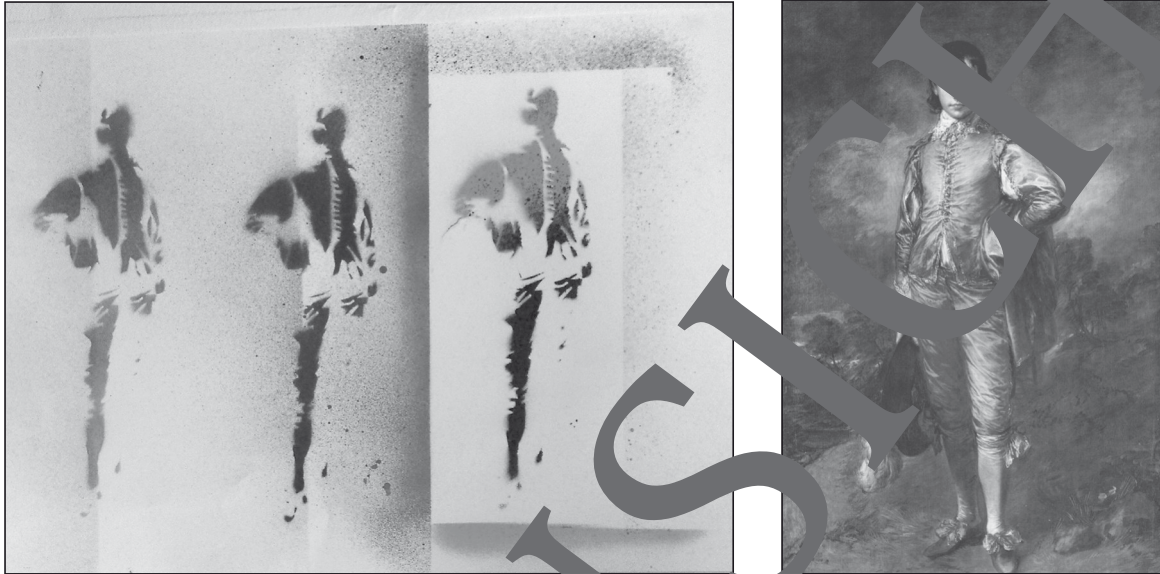
Schablonengraffiti zu Thomas Gainsboroughs „The Blue Boy“ (rechts)

Die Kunst als Teilung in der Welt führt durch Nachbilden berühmter Motive immer wieder zu Neuinterpretationen. Diese Unterrichtseinheit ermöglicht es Schülerinnen und Schülern, Kunstgeschichte mit den Mitteln der Street-Art neu zu interpretieren. Sie wählen historische Werke aus und verleihen ihnen durch ein individuelles Schablonengraffiti eine neue Aussage. Die Recherche nach geeigneten Vorlagen für Graffitischablonen erfordert eine genaue Betrachtung von Form, Farbe, Licht, Haltung und Gestalt. Während die Gestaltung der Schablone genau geplant werden muss, lässt die praktische Umsetzung den Schülerinnen und Schülern viel Raum für kreatives Experimentieren.