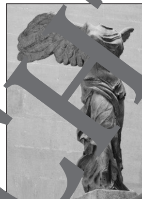
Nike von Samothrake

Erste Darstellungen barfüßiger, mit Flügeln ausgestatteter lichter Wesen in Menschengestalt kommen schon in vorchristlicher Zeit vor, etwa in den Kulturen Mesopotamiens. Dort wurden sie als Mittler zwischen Göttern und Menschen verstanden. Später, in der griechischen Mythologie, werden sie nicht mehr benötigt. Nun greifen geflügelte Götter selbst in das Leben der Menschen ein, wie es der Fries des Pergamonaltars in Berlin oder die mit ausgebreiteten Flügeln herbeieilende, Sieg und Frieden verkündende Nike von Samothrake (Louvre) zeigen. Sie wurde Ende des 19. Jahrhundert Vorbild für zahlreiche geflügelte Siegesgöttinnen im Stil des Historismus und unter anderem 1866 von Friedrich Drake (Berlin) und noch im 20. Jahrhundert von Yve Klein als „Sieg der Samothrake“ kopiert.