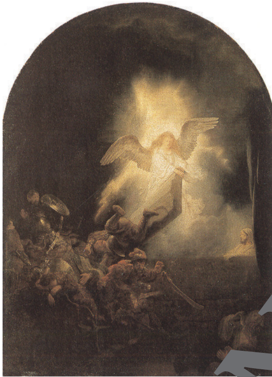
Rembrandt: „Auferstehung Christi“ (aus dem Passionszyklus für den Statthalter Frederik Hendrik von Oranien, 1639; Öl auf Leinwand, Alte Pinakothek München)

Margarete Luise Goecke-Seischab, Planegg