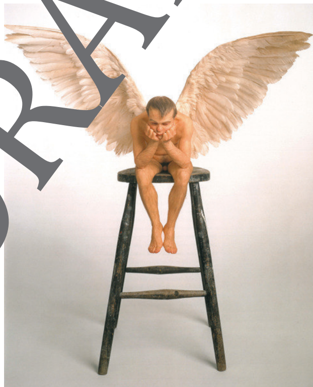
Ron Mueck: „Angel“, 1997; Mischtechnik, Silikon-Kautschuk, Gänsefedern, 110 cm Höhe, Hoffman Collection, Dallas. © Ron Mueck