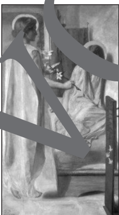
Dante Gabriel Rossetti

Bis in das 19., 20. und frühe 21. Jahrhundert gestalteten Künstler immer wieder Engel, doch nun in ganz unterschiedlicher und sehr subjektiver Weise, wie etwa der zu den Präraffaeliten zählende englische Maler Dante Gabriel Rossetti . Sein übermächtiger, in Rückenansicht dargestellter Verkündigungengel scheint Maria auf ihrem Ruhelager zu erschrecken und zu ängstigen. Paul Gauguin malte 1888 Jakobs Kampf mit dem ihm weit überlegenen Engel klein und fast versteckt im Hintergrund eines Bildes, das eigentlich bretonische Frauen mit ihren typischen Flügelhauben nach dem Kirchgang zeigt. 1903 entstand das Bild des finnischen Malers des Symbolismus Hugo Simberg mit dem Titel „ Der verwundete Engel “. Auf diesem tragen zwei Jungen einen traurig auf einer Bahre sitzenden Engel, der sich am Flügel verletzt hat. Mit geballter Faust, wütend und fast aufsässig, droht