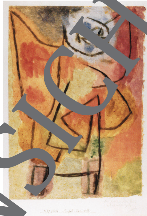
Paul Klee: „Engel über voll“, 1939, 896 (WW16); Aquarell und Bleistift auf Papier auf Karton, 52,5 x 36,5 cm; Privatsammlung Bern