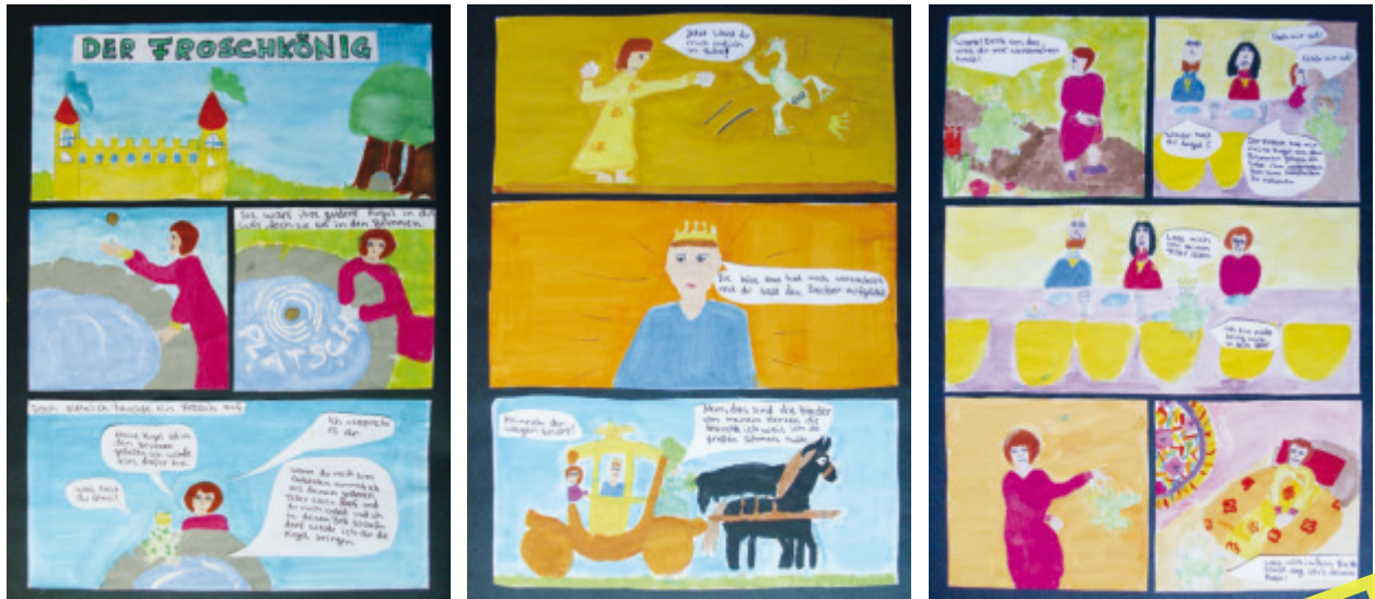
Schülerbeispiele: Bildergeschichte zu „Der Froschkönig“