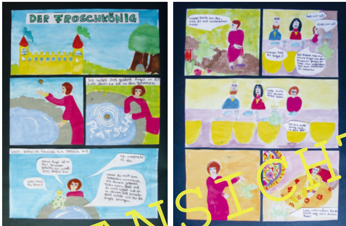
„Der Froschkönig“ als Bildergeschichte (Schülerarbeit)

„Es war einmal ...“ – Märchen sind Einladungen in das Reich der Fantasie, der Träume und Wünsche. Hier trifft man auf geheimnisvolle Zauberwesen, sprechende Tiere, schöne Prinzessinnen und tapfere Helden. Doch was wären diese Welten ohne Bilder?