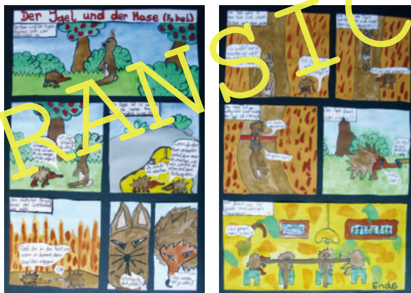
Schülerbeispiele: Bildergeschichte zu „Der Hase und der Igel“