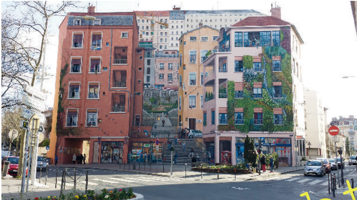
CitéCréation: „Le mur des canuts“, 1987; Wandgemälde, 1200 m 2 ; Boulevard des Canuts, Lyon.