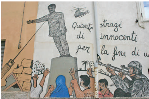
Murales in Orgosolo (Sardinien).