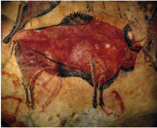
Darstellung eines Bisons in Altamira/Spanien; Höhlenmalerei; ca. 15 000 v. Chr.