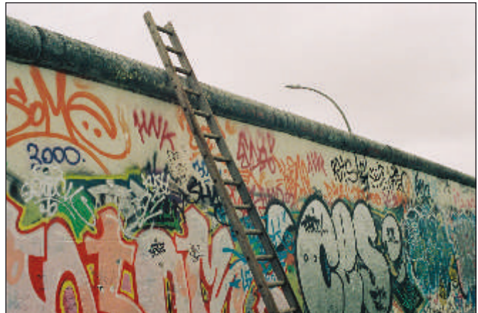
Graffitis an der Berliner Mauer

Im Gegensatz zur modernen „Mauerkunst“, etwa den Graffitis an der Berliner Mauer , werden unter klassischer Wandmalerei meist großformatige, auf Wände, später auch an Decken oder in Kuppeln gemalte Bilder verstanden. Wurden die Gemälde in frühester Zeit meist „al secco“, also „aufs Trockene“ aufgetragen, so erfolgte der Wandauftrag später oft „nass in nass“, um die Farbe mit dem noch feuchten Putz haltbarer zu verbinden („al fresco“). Das bedeutete allerdings auch, dass an einem Tag nur jeweils so viel frischer Putz aufgetragen wurde, wie auch bemalt werden konnte.