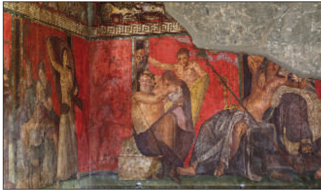
Wandmalerei in Pompeji, Italien

Wenn auch Wandmalereien aus frühester Zeit fast nur in abgeschiedenen Höhlen, in Gräbern und Grabkammern überdauert haben, so ist doch davon auszugehen, dass schon sehr früh auch Paläste (Kreta) und Profanbauten (auf Santorin ) reich mit diesen oft monochromen figürlichen Malereien ausgestattet waren. Vor allem reiche Römer leisteten sich den Luxus, die