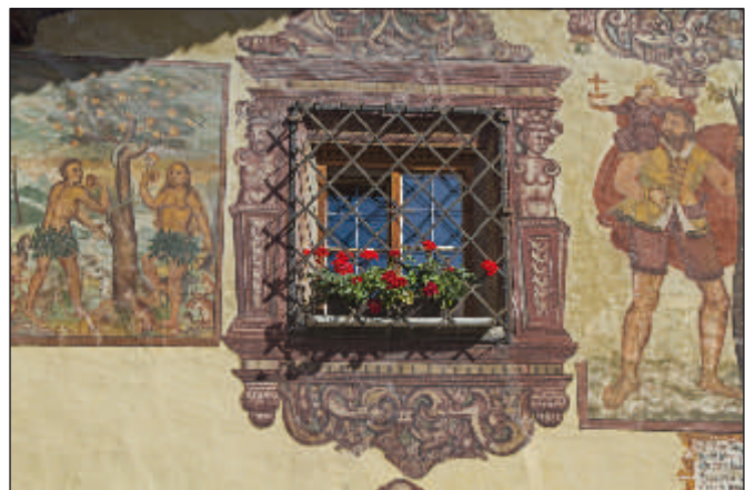
Lüftlmalerei mit Darstellung des heiligen Christophorus (rechts)

Wohl auch schon seit dieser Zeit entwickelte sich eine alpenländische Besonderheit, die großflächige außen an Hauswänden angebrachte Lüftlmalerei . Bevorzugtes Thema, und bis heute noch verbreitet, ist der riesengroß dargestellte heilige Christophorus, der, einen Wanderstab in der Hand, ein Kind auf den Schultern über einen Fluss trägt. Der Legende nach wurde die Last immer schwerer, während gleichzeitig das Wasser immer höher stieg, bis sich das Kind als Christus zu erkennen gab und den Riesen auf den Namen Christophorus taufte.