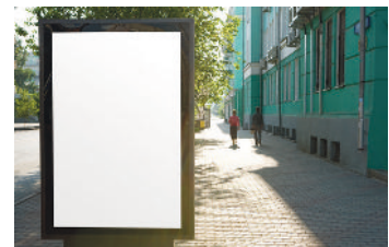
Viel Platz für dein Werbeplakat!

Gestalte mit Fotos, als Zeichnung und/oder Collage ein Werbeplakat für deine Pralinen. Überlege dir einen Hintergrund, mache dir Gedanken zu Größe, Gestaltung und Farbe der Schrift. Welchen Namen sollen die Pralinen haben? Denke auch daran, dir einen Werbeslogan (Werbespruch) zu überlegen.