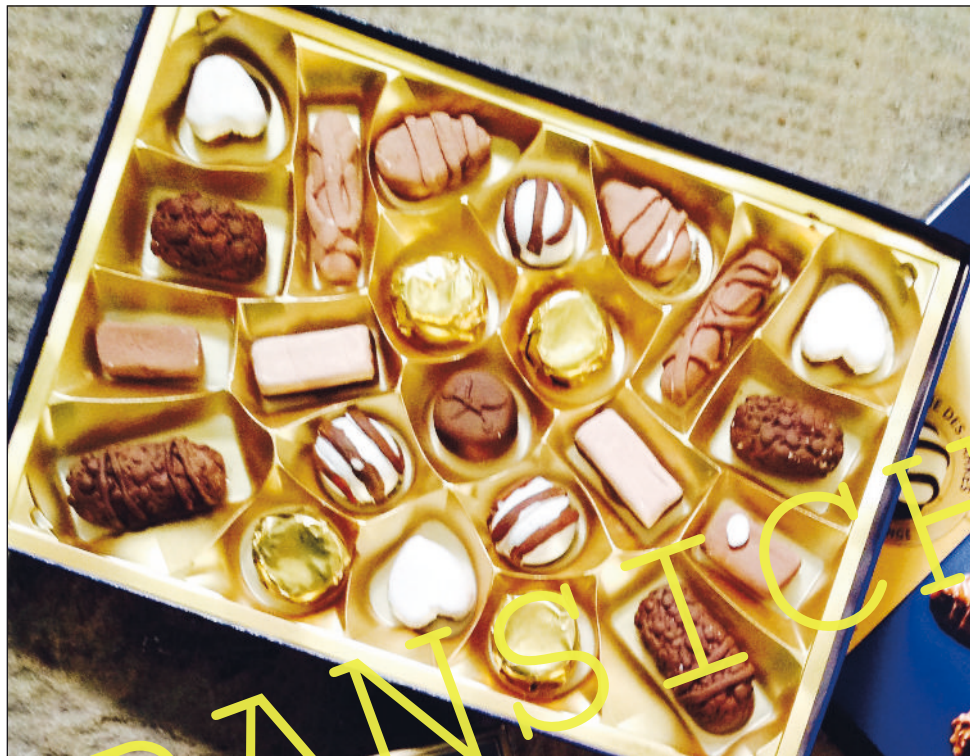
Schokopralinen aus Soft-Ton (Schülerbeispiel Klasse 7)

In dieser Einheit gelingt das Spiel mit der süßen Warenwelt und ihren Verlockungen. Der Anblick einer Eistüte oder eines Tortenstücks ist uns vertraut. Überraschend wird es, wenn das Eis meterhoch oder die Torte mit Kartons gefüllt ist. Der Pop-Art-Künstler Claes Oldenburg hat es vorgemacht – und auch Ihre Schülerinnen und Schüler setzen für die plastische Ausgestaltung von Pralinen ein besonderes Material ein.