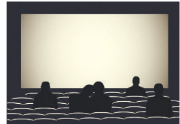
Film ab für deinen Werbefilm!

Dreh mit deinem Smartphone oder einer Kompaktkamera einen kleinen Werbefilm für deine selbst hergestellten Pralinen. Berücksichtige dabei, wie du deine Pralinen am besten in Szene setzt, und achte auf die Lichtverhältnisse. Welchen Namen sollen die Pralinen haben? Überlege dir auch einen passenden Werbeslogan (Werbespruch). Und wie lautet der Werbetext, den du während des kleinen Filmes sagen möchtest?