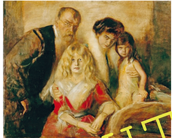
Franz von Lenbach: „Selbstbildnis mit Frau und Töchtern“, 1903; Öl auf Pappe; 99,5 x 122 cm.