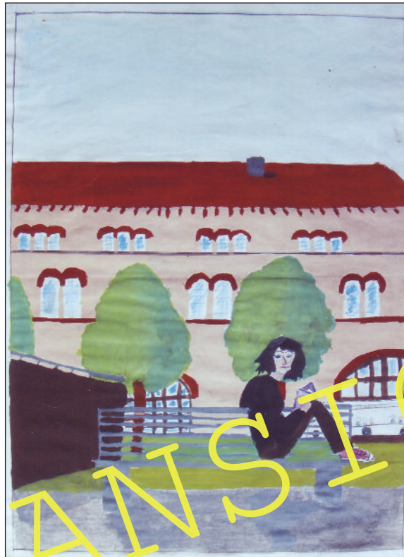
Lesen in der eigenen Stadt – ein Schülerbeispiel aus Kaiserslautern