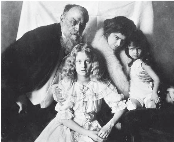
Franz von Lenbach: Familienfoto mit Frau und Töchtern, 1903, Fotografie, mit Selbstauslöser aufgenommen, 13 x 18 cm.

Neben berühmten Persönlichkeiten seiner Zeit – wie etwa Reichskanzler Bismarck – hat Franz von Lenbach auch sich selbst mit seiner Familie gemalt. Für das Ölgemälde von 1903 fertigte er zuvor eine Fotografie mithilfe eines Selbstauslösers an.