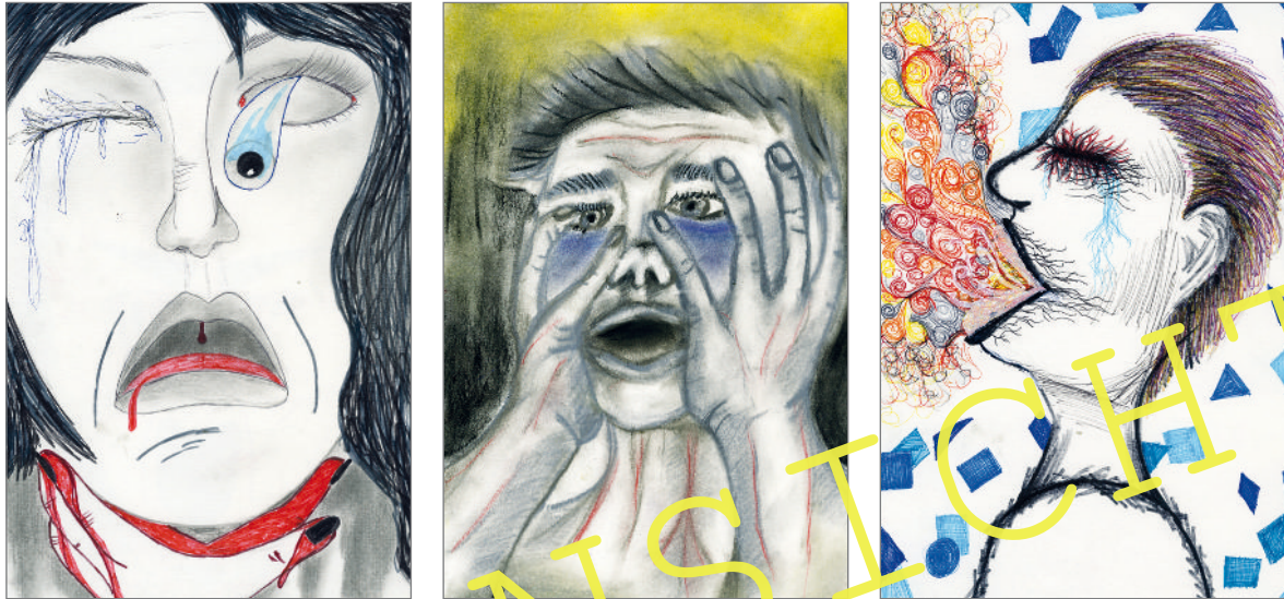
Schülerbeispiele zum Thema „Leid und Schmerz“ - Vorbereitung für die Betrachtung von Picassos Guernica

Pablo Picassos Schaffensperiode in den 1930er- und 1940er-Jahren ist geprägt von persönlichen Beziehungskonflikten sowie sich dramatisch entwickelnder weltpolitischer Ereignisse. In diesem Spannungsfeld von privater Zerrissenheit und dem sich anbahnenden Zweiten Weltkrieg wird die schöpferische Ausdruckskraft des Jahrhundertgenies Picasso thematisiert, der wie ein Seismograf seinen Betrachtungen und Visionen zu individuellen und universalen Vorkommnissen in malerischer Darstellung Ausdruck verleiht. In dieser Unterrichtseinheit werden Ihre Schülerinnen und Schüler angeregt, anhand des Werks Guernica und ausgesuchter Bildnisse aus der Serie der „Weinenden Frauen“ neben ausführlichen Werkanalysen über Nähe und Distanz in der Selbst- und Fremdwahrnehmung nachzudenken und zu äußeren Vorgängen in Beziehung zu setzen.