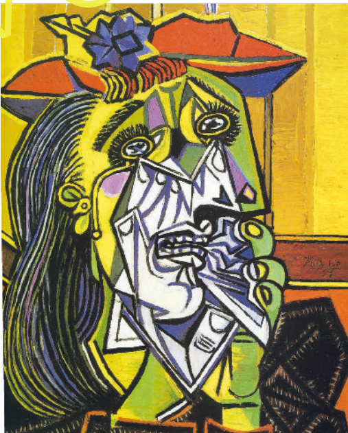
Pablo Picasso: „Weinende Frau“, 26. Oktober 1937, Öl auf Leinwand, 60 x 49 cm, Privatbesitz, England.