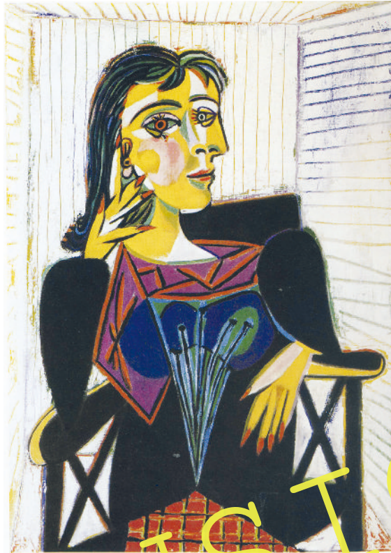
Pablo Picasso: „Bildnis Dora Maar“, 1937; Öl auf Leinwand, 92 x 65 cm; Musée Picasso Paris.