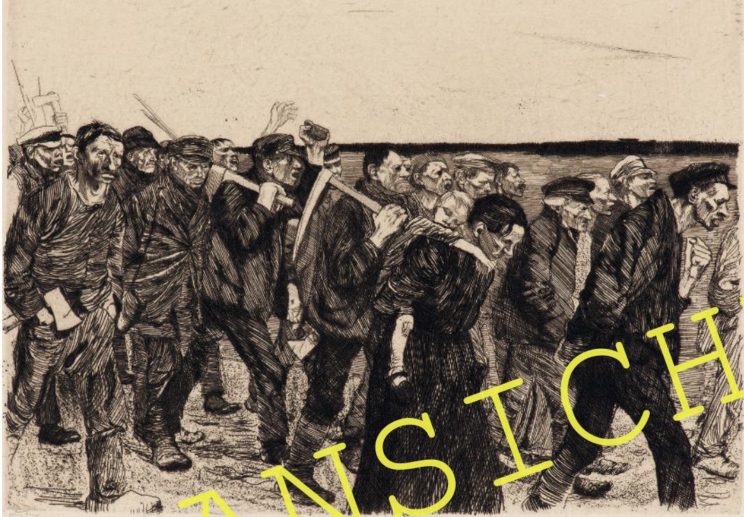
Käthe Kollwitz: „Weberzug“, Blatt 4 aus dem Zyklus „Ein Weberaufstand“, 1893-97; Radierung, 22 x 30 cm

Margarete Luise Goecke-Seischab, Planegg