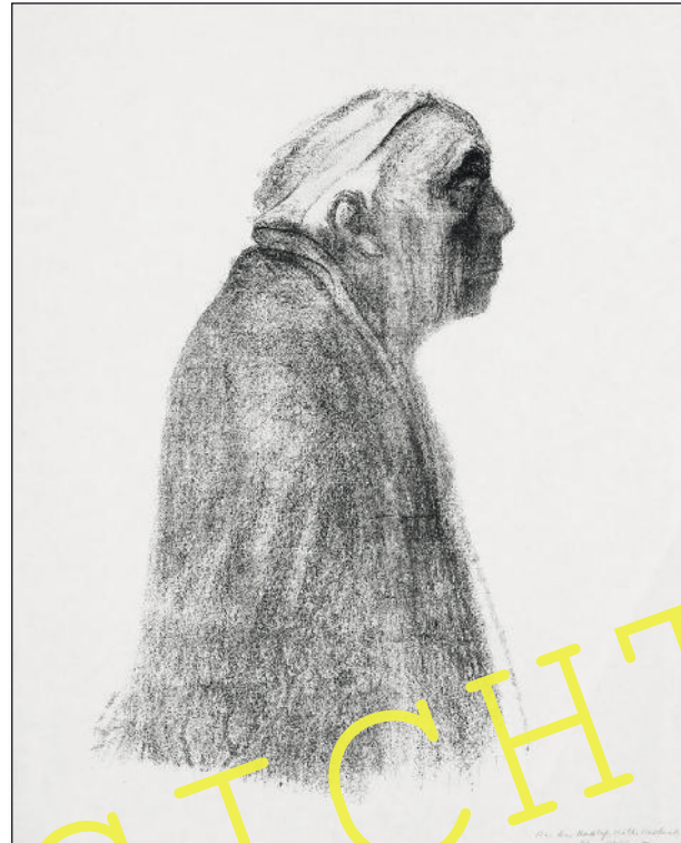
„Selbstbildnis im Profil nach rechts“, 1938, Lithografie