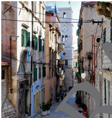
Gasse in der Altstadt

Die Stadt hat etwa 43.000 Einwohnerinnen und Einwohner. Sie liegt an der Adriaküste im Süden Kroatiens an einem natürlich geschützten Hafen. Das wichtigste Bauwerk Šibeniks ist die Kathedrale des Heiligen Jakob, erbaut von 1431 bis 1535, deren Dach aus einem Tonnengewölbe aus freitragenden Steinplatten besteht. Die Kathedrale gehört seit dem Jahr 2000 zur Liste des Weltkulturerbes der UNESCO. Šibenik ist eine Stadt der Treppen mit über 2.800 Treppenstufen innerhalb seiner Gassen. Das im 11. Jahrhundert entstandene venezianische Verteidigungssystem mit den vier Festungen von Šibenik befindet sich seit 2017 auf der Liste des UNESCO-Weltkulturerbes. Im Balkankrieg kam es 1991 zu Kampfhandlungen, in deren Folge viele Gebäude beschädigt wurden. Obwohl Šibenik, gelegen an der Mündung der Krka, als Tor zu den gleichnamigen Wasserfällen gilt, bleibt es wegen der mäßigen Strandflächen und eines nicht ausgereiften und tiefen Hafens für Kreuzfahrtschiffe nur schlecht erreichbar.