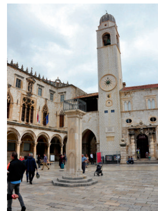
Arkaden des Sponza-Palastes