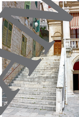
Stadt der vielen Treppen