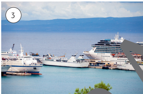
Kreuzfahrtschiffe im Hafen von Spalato