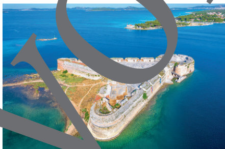
Blick auf eine Festungsanlage