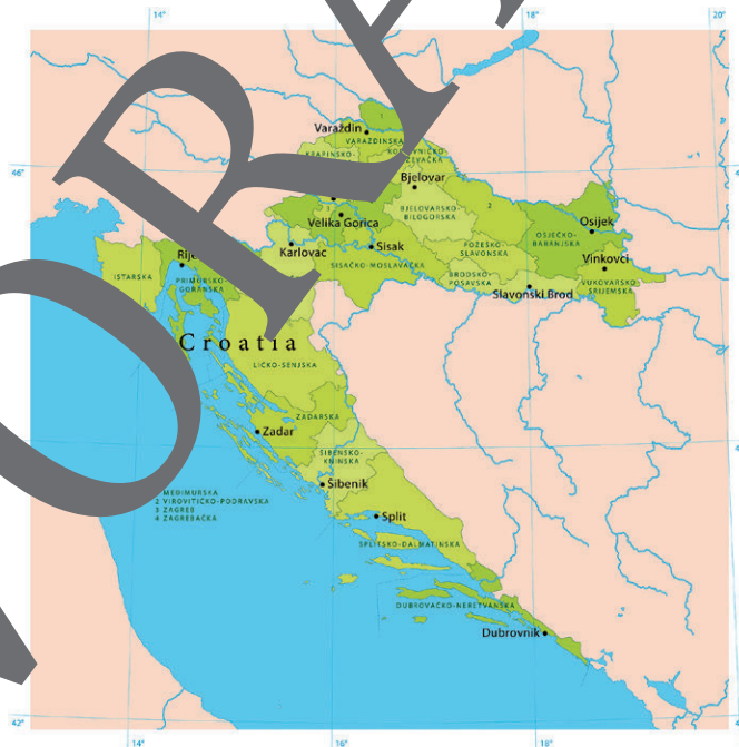
Karte: Frank Ramspott/Digital Vision Vectors

Die Küstenlänge Kroatiens beträgt (ohne Inseln) 1.777 km und mit den Inseln fast 6.000 km.