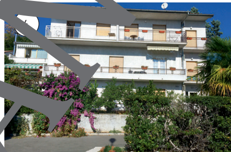
Ferienwohnungen in Opatija im Oktober