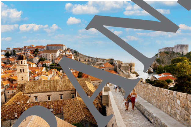
Touren auf der Mauer