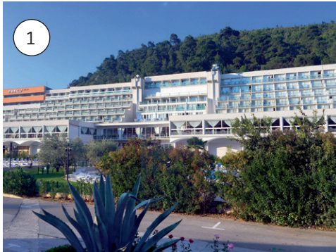
Hotelreihe in Rabac nahe Opatija in der Kvarner Bucht