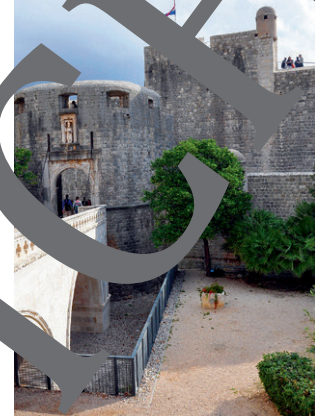
Einlass in die Altstadt, Westtor