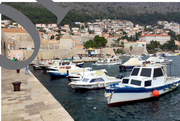
Marina jenseits des Osttores