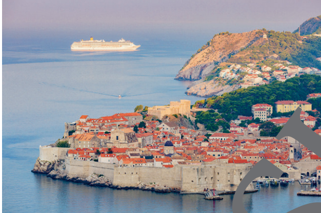
Kreuzfahrtschiff vor der Altstadt von Dubrovnik