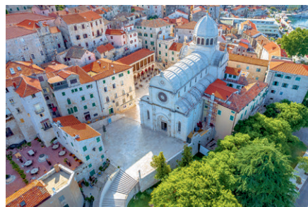
Kathedrale des Heiligen Jakob