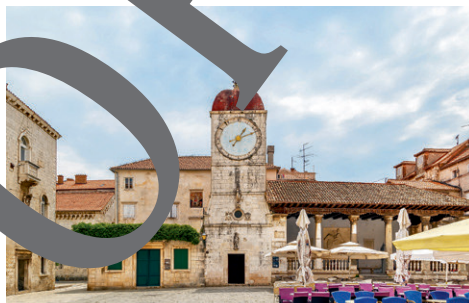
Zentraler Platz mit Uhrenturm