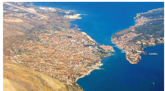
Altstadt von Trogir