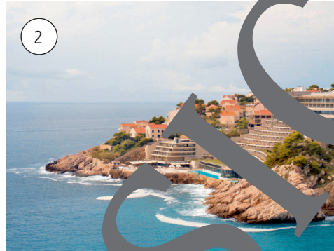
Hotelkomplex in Gruz in der Region Dubrovnik