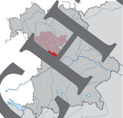
Karte: Tubs/cc by sa3.0