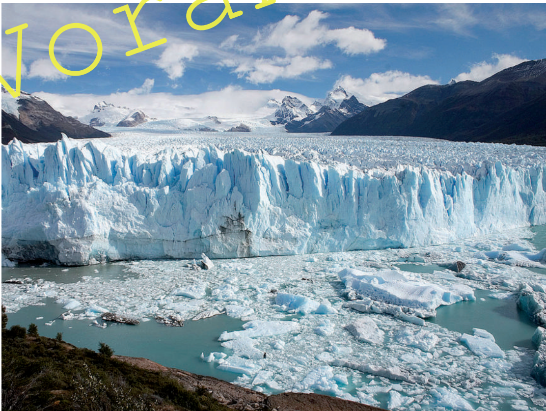
Spalten in der Oberfläche des Gletschers nahe der Kalfungsfront