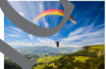
vacaciones de aventura