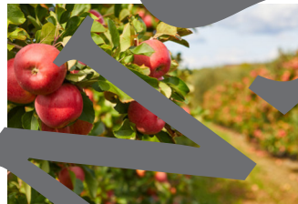
vacaciones en el campo