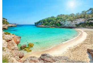
vacaciones en la playa