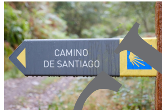
viaje de peregrinación