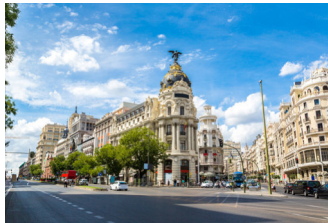
vacaciones en la ciudad