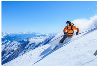
vacaciones de esquí