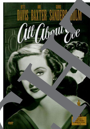
20th Century Fox

6. ¿Qué foto busca y trae Manuela? ¿Por qué?