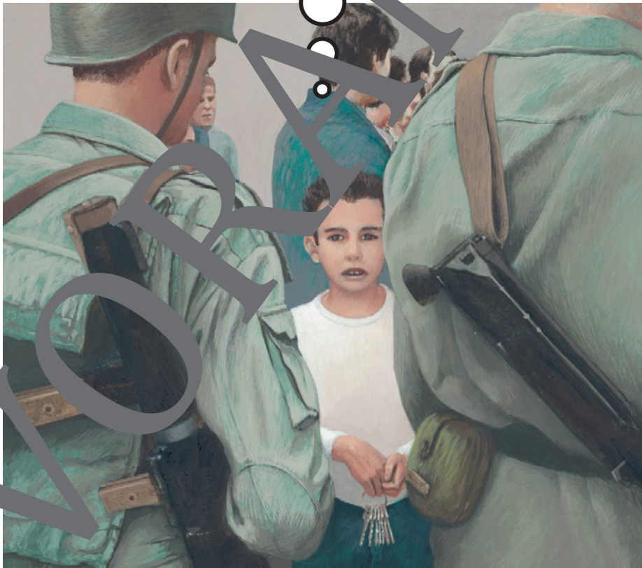
© Skármeta, Antonio/Ruano, Alfonso: La composición. Ediciones Ekaré, Caracas/Venezuela 2005.