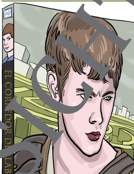
Illustration: Julia Lenzmann