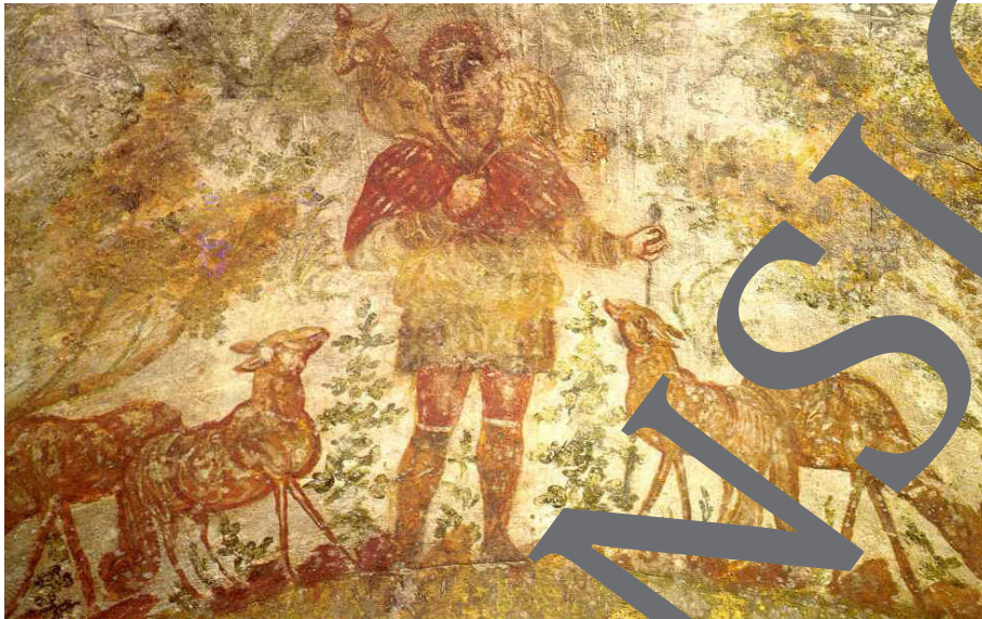
Jesus as the Good Shepherd from the early Christian catacomb of Domitilla, Rome.