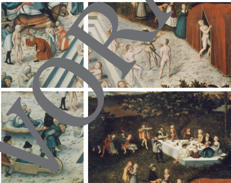
Bildausschnitte: Cranach der Ältere: Der Jungbrunnen, 1546. Gemälde auf Holz.