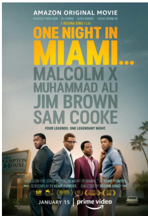
One Night in Miami