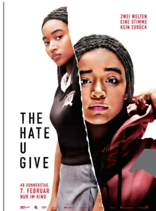
The Hate U Give