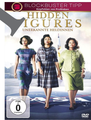
The hidden Figures

Nachweise zu den Filmplakaten: One Night in Miami © Snoot Entertainment/ABKO Films. The Hate U Give © State Street Pictures/Temple Hill Entertainment. The Help © Dream Works Pictures. Hidden Figures © Twantine Films/Chernin Entertainment/Fox 2000 Pictures.