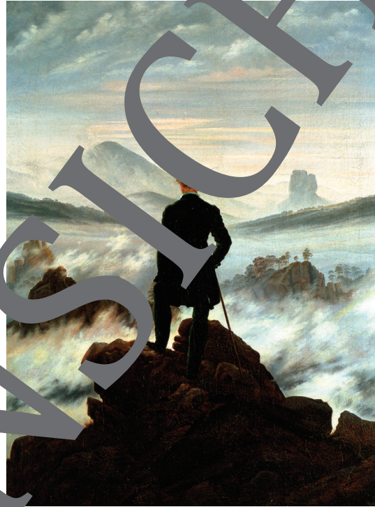
Caspar David Friedrich: Der Wanderer über dem Nebelmeer, (um 1818).

Die Heiterkeit ist eine geistige Haltung, die der Fröhlichkeit ebenso viel Bedeutung zumisst wie der Traurigkeit. Die Gelassenheit ermöglicht das Gewährenlassen auch des Abgründigen und Widersprüchlichen, der Angst im Kontrast zum Freisein von ihr, des Schmerzes im Kontrast zur Lust, des Leids im Kontrast zur Freude, des Todes im Kontrast zum Leben. Sich der grundlegenden Tragik von