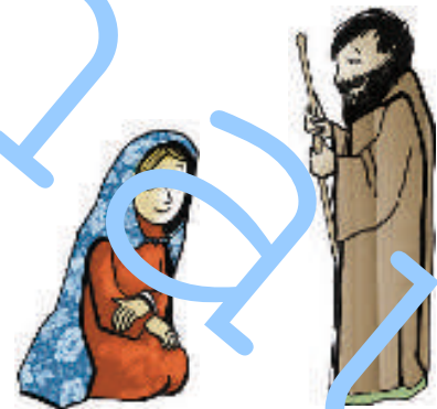
Zeichnungen: Liliane Oser.