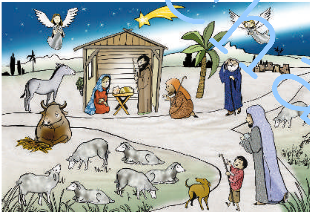
Zeichnung: Liliane Oser.

Text: Einheitsübersetzung der Heiligen Schrift. © 1980 Katholische Bibelanstalt, Stuttgart.