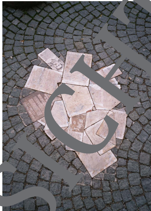
Denkmal für die Weiße Rose“ vor der LMU München.

45 der Hoffnung, dass ein anderer die Waffen erhebt, um Dich zu verteidigen? Hat Dir nicht Gott