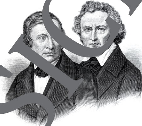
Jacob (1795–1863) und Wilhelm Grimm (1786–1859)

großen, vermachte, federleicht, vierblättriges, bloßer, innerlichen, geputzt, großen, angeschwollenen, flink, aufgehobenen, blau blühenden