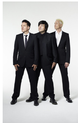
Nela König ( www.nelakoening.com )/Hot Action Records (Plattenlabel von „Die Ärzte“)

Störkraft und Onkelz (gemeint ist die Band „Böhse Onkelz“) = Rechtsrockbands der 1980er und 1990er, mit eindeutigen (Störkraft) und teilweise verdeckten (Böhse Onkelz) neonazistischen und ausländerfeindlichen Songtexten, in denen auch zur Gewalt gegen politische Gegner aufgerufen wird – Kuschelrock-LP = Sammlung von LPs und CDs der Jugendzeitschrift „Bravo“ mit „Schmusesongs“.