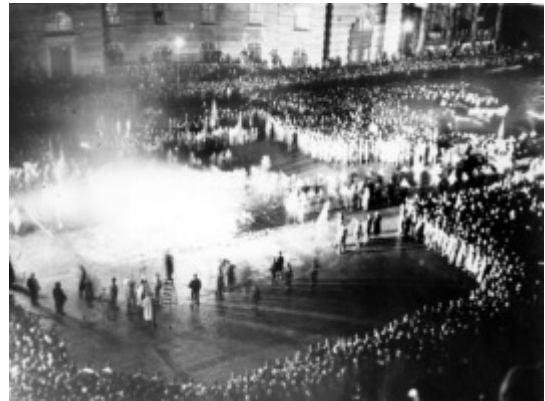
Bücherverbrennung auf dem Opernplatz in Berlin am 10. Mai 1933.