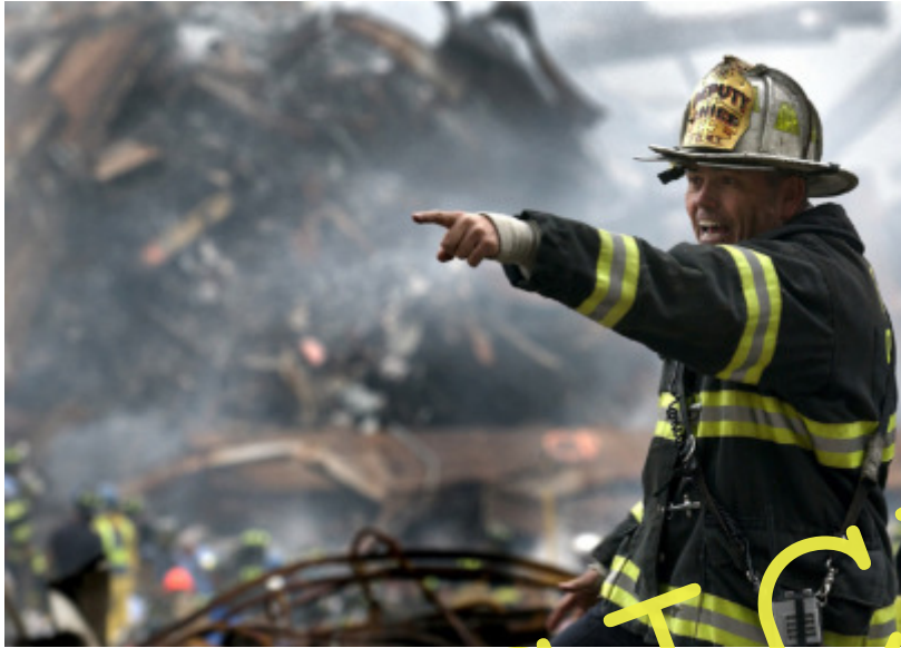
Die Figuren um Montag herum

Im Roman tauchen viele unterschiedliche Personen auf, die alle etwas mit der Hauptfigur Montag zu tun haben, manchmal sehr direkt, manchmal eher auf Umwegen. Hier kannst du überprüfen, inwiefern du die Rollen der Figuren richtig erfasst hast.