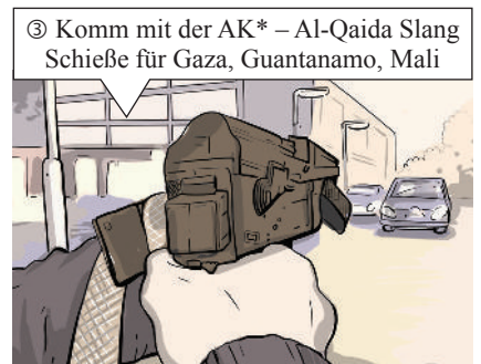
③ Komm mit der AK* – Al-Qaida Slang Schieße für Gaza, Guantanamo, Mali