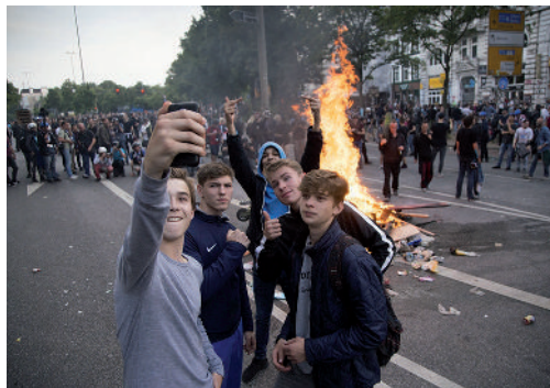
08.07.2017: Hamburg, G20-Gipfel