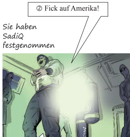
② Fick auf Amerika!