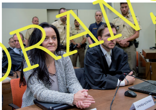
25.07.2017: München, NSU-Prozess