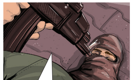
④ Doch spuck auf den Hahn der Equipe tricolore