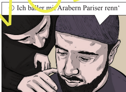
① Ich baller mit Arabern Pariser renn'