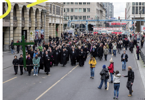
14.04.2017: Berlin, Karfreitagsprozession