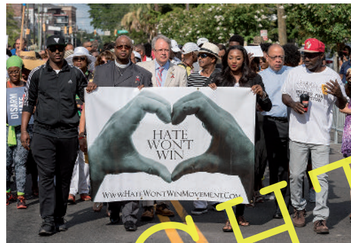
17.06.2017: Charleston (USA), „Hate won't win“