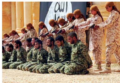
Mai 2015: Palmyra (Syrien), Massenexekution syrischer Soldaten durch Kinder des IS