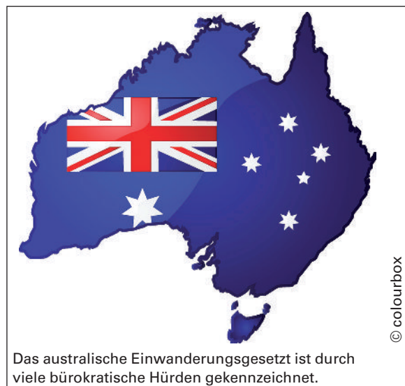
Das australische Einwanderungsgesetz ist durch viele bürokratische Hürden gekennzeichnet.

Text nach: www.germany.embassy.gov.au/belngerman/Visas_and_Migration .