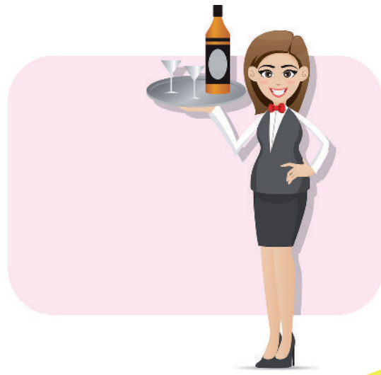
Im Urlaubsland Geld verdienen.

Besonders beliebt sind Ferienjobs im Gastronomiebereich oder in der Tourismusbranche. Auch Angebote außerhalb der EU (z. B. in Australien oder in den USA) sind sehr gefragt. Allerdings ist es für Europäerinnen oder Europäer sehr viel leichter, innerhalb der EU einen Ferienjob zu bekommen, da sie kein Visum beantragen müssen und auch ohne bürokratische Hürden innerhalb der EU leben und arbeiten dürfen.