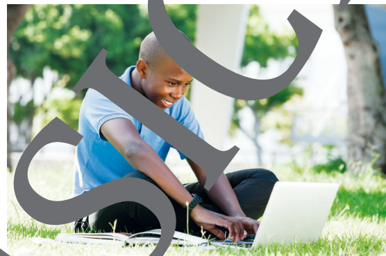
Der frankophone Senegal – zwischen Tradition und Moderne – auf dem Weg ins 21. Jahrhundert